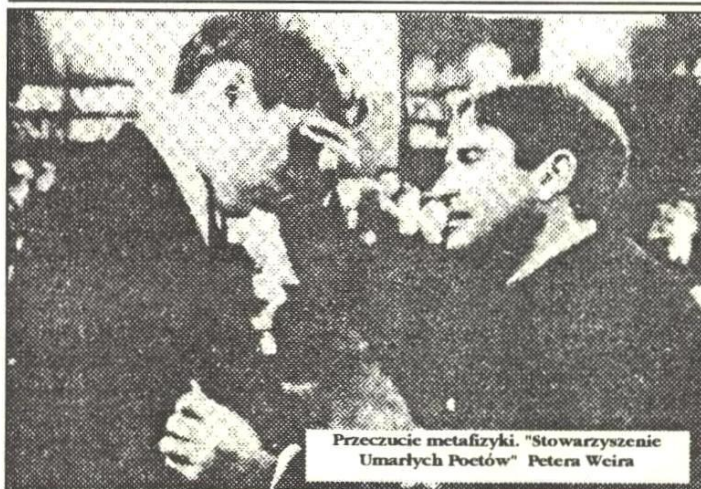
Przecucie metafizyki. "Stowarzyszenie Umarłych Poetów" Petera Weira